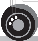
■ Fig.1 ☒ 1